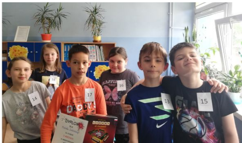
Drużyna z naszej szkoły