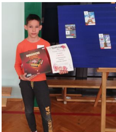
Zdobywca I miejsca